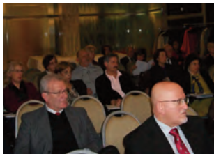
Assemblea Ordinaria Annuale Soci 2011

È possibile scaricare i documenti che riguardano l'Assemblea annuale dei Soci 2011 (Verbale Assemblea Annuale Soci 2011, Rapporto di attività 2010, Linee Direttive 2011, Bilancio consuntivo