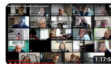
Dibattito con pazienti su Vaccinazioni, Nota99, Riabilitazione... 186 visualizzazioni • Trasmesso in streaming 8 mesi fa