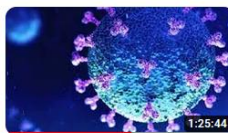
Le conseguenze del COVID nel malato respiratorio cronico 766 visualizzazioni • Trasmesso in streaming 3 settimane fa