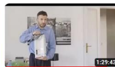
Webinar BPCO su 'Uso dispositivi portatili e Ossigenoterapia' 900 visualizzazioni • Trasmesso in streaming 2 mesi fa